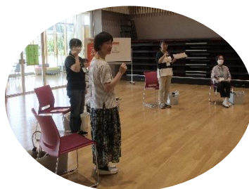
(さあ、では皆さんの近況報告から)