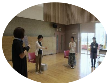
(お話する順番は、あとだしじゃんけん～)

🔪 皆様の近況をうかがって、一人ひとりの方が人生を生きているんだ!!と思いました。若い方は家族のことで、上の世代は自分の健康のため、また、研修で自己啓発を学ぶことになった方もいて、勉強になりました。ビジター訪問では、やっぱり、様々感じていたのだと、とても勉強になりました。